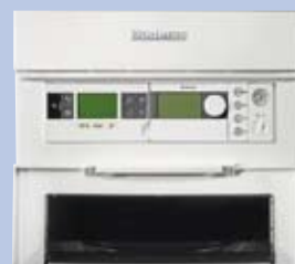
Le contrôleur de base, facilement accessible