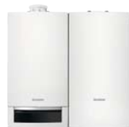
Logamax plus GB172 avec Logalux H65W placé à côté

La Logamax plus GB172 est compatible avec de multiples systèmes de cheminées. Peu importe l'endroit où est placée votre chaudière (cave, grenier, cuisine, etc., ...), une solution homologuée existe pour l'évacuation des gaz de combustion.