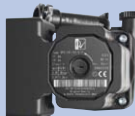
La pompe modulante Bosch classe A